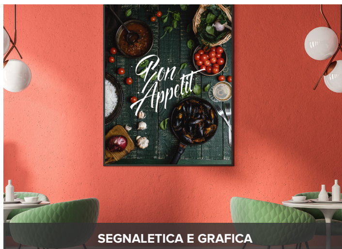
SEGNALETICA E GRAFICA