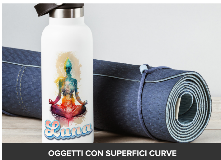
OGGETTI CON SUPERFICI CURVE