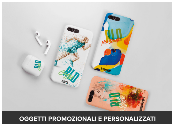
OGGETTI PROMOZIONALI E PERSONALIZZATI