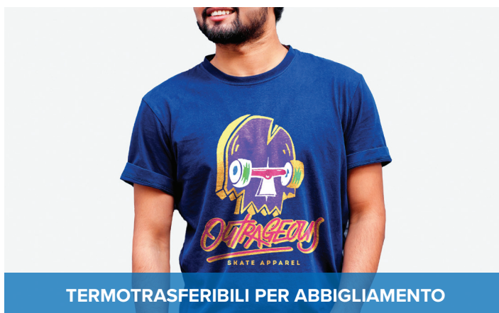
TERMOTRASFERIBILI PER ABBIGLIAMENTO