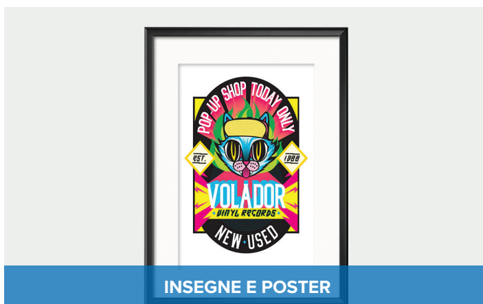
INSEGNE E POSTER